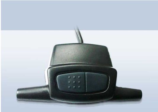
Радиомодуль авто сигнализации Pandora DXL3000 (радиомодуль)