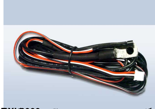
DM-2000 для подключения к Pandora DXL3000 для Pandora