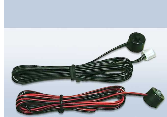
Активация датчика удара Pandora DXL3000 с помощью датчика удара (например датчика