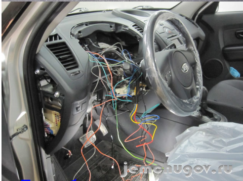
Поставлена автосигнализация с автозапуском Starline A91 Dialog на Toyota Corolla Verso 2008 с кнопкой Push Start Engine.