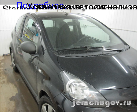
Получить Starline A91 Dialog на Toyota Aygo 2008. Установка автосигнализации Starline A91 Dialog, замок с автозапуском, также может быть установлена на авто