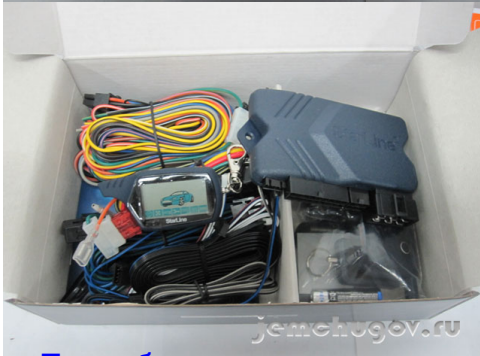
Получить Установка автосигнализации Starline A91 Dialog, замок КПП Bear Lock, камеры заднего вида. Пример установки сигнализации с автозапуском Starline A91 Dialog, блокиратора коробки перед