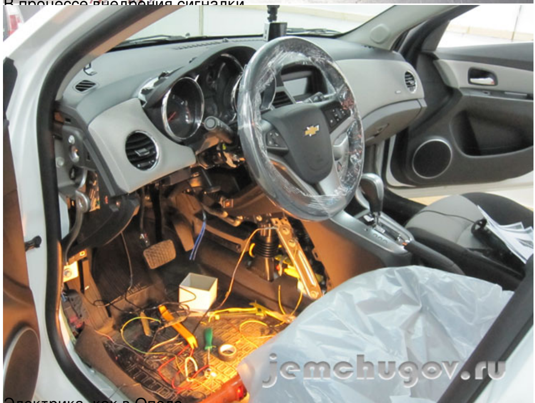
Электрика, как в Опеле