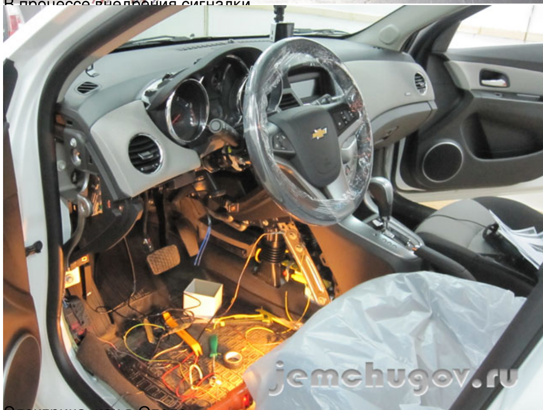
Электрика, как в Опеле