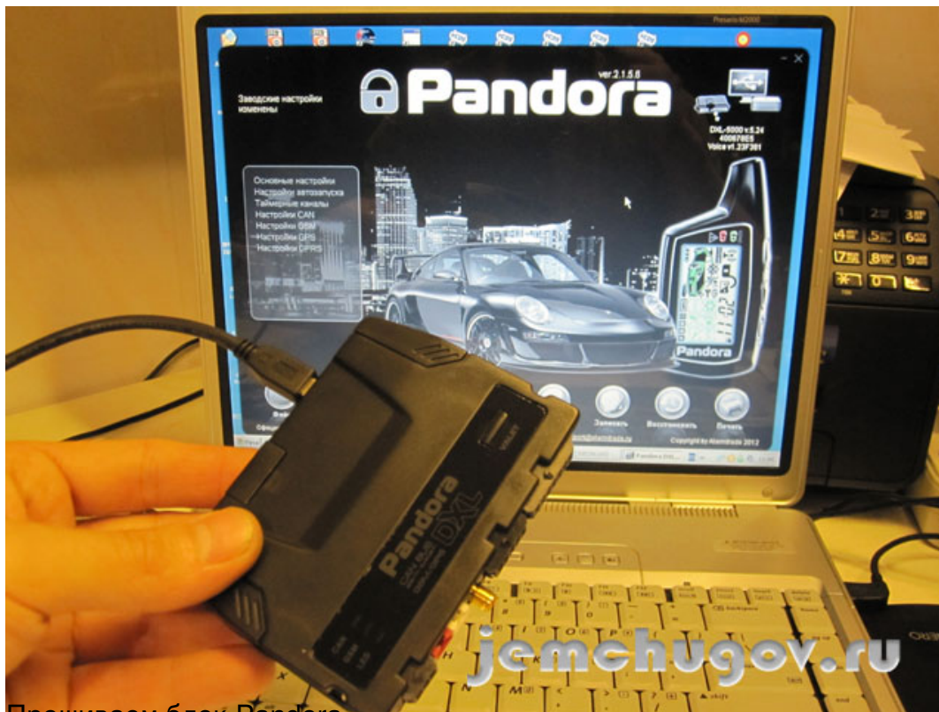
Прошиваем блок Pandora