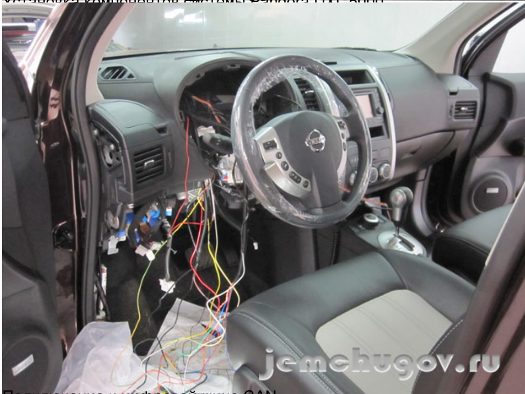
Подключение к цифровой шине CAN