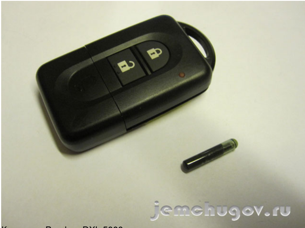
Комплект Pandora DXL 5000