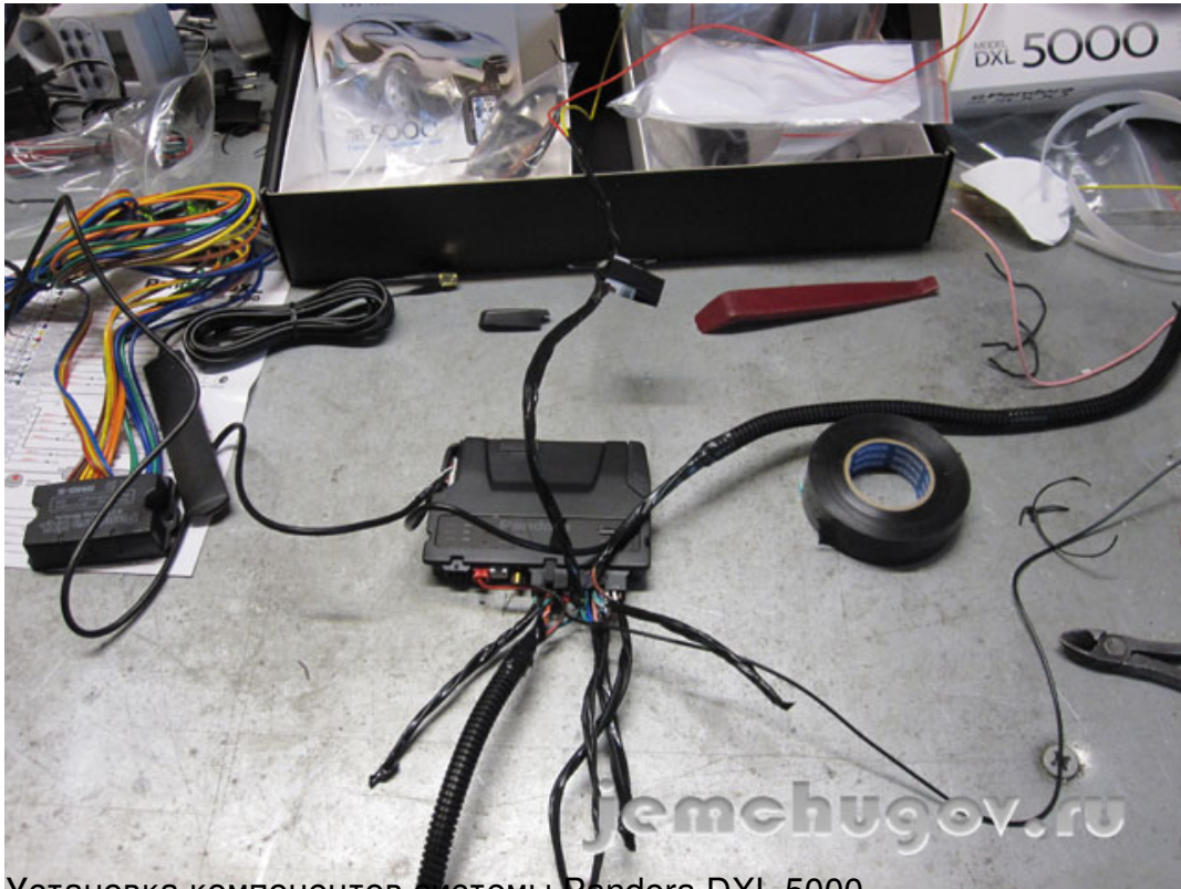
Установка компонентов системы Pandora DXL 5000