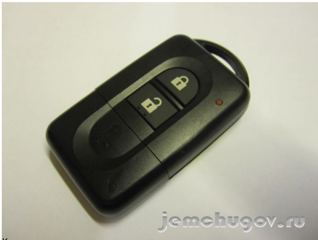
Клонирование транспондера в ключе