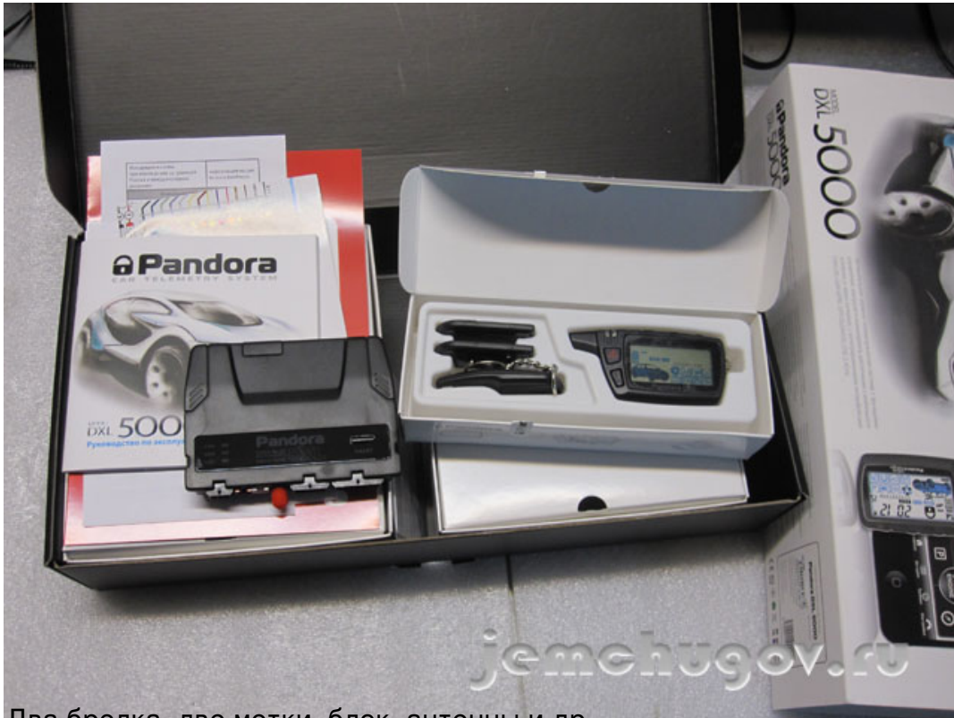
Два брелка, две метки, блок антенны и др.