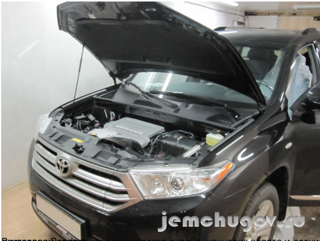
Вид двигателя Pandora DXL 5000 с датчиком температуры двигателя, датчиком температуры капота и датчик температуры