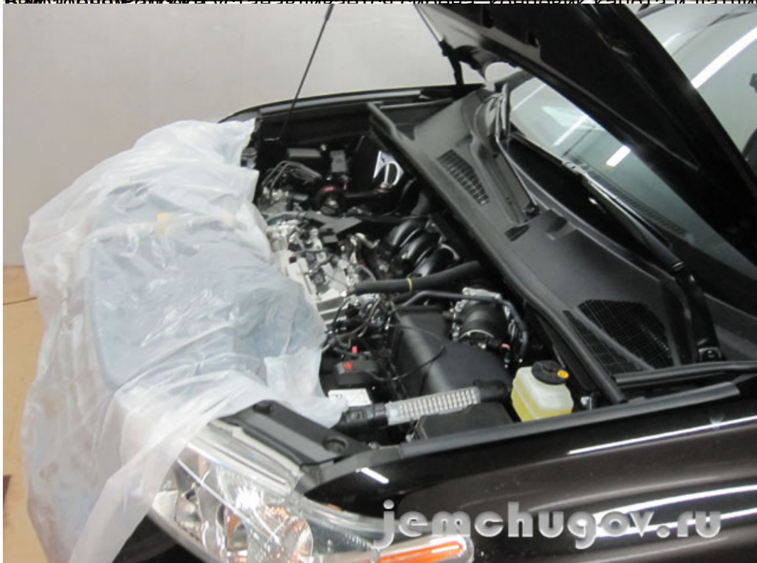
5000 с датчиком температуры двигателя, датчиком температуры капота и датчик температуры Pandora DXL