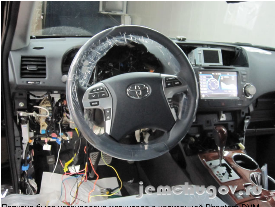
Подручно была установлена магнитола с навигацией Phantom-DVM