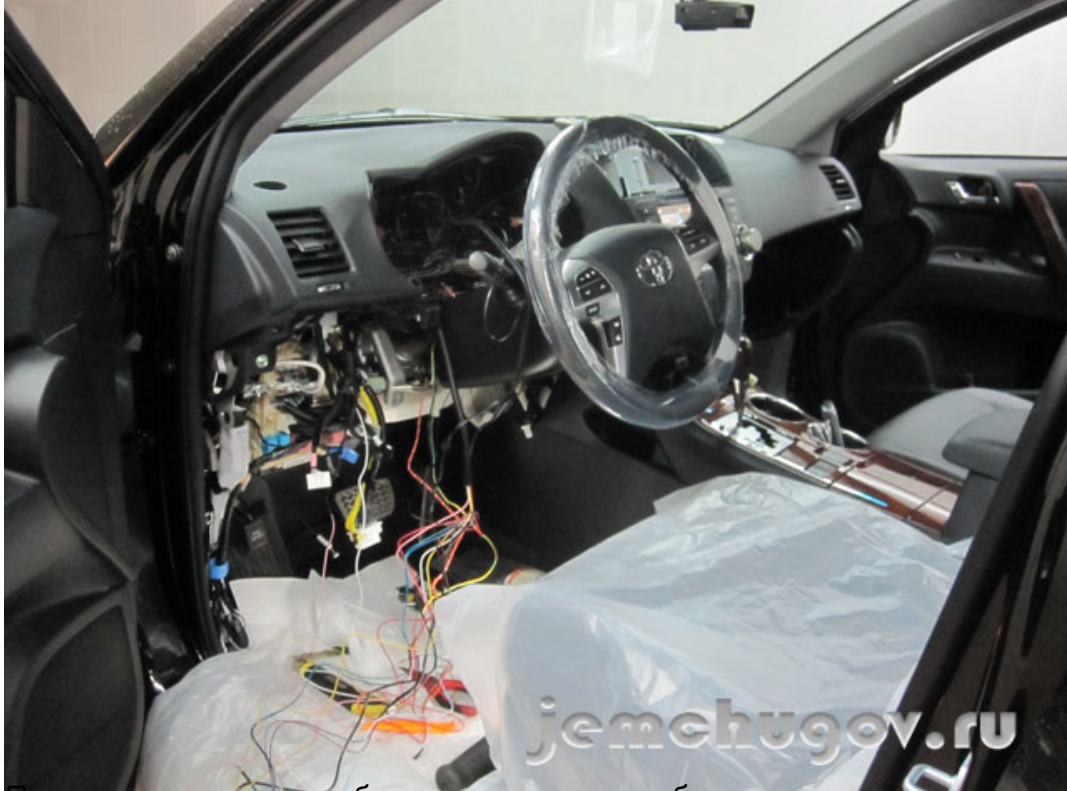
Подключаются все необходимые провода, обходчик, цепи для автозапуска