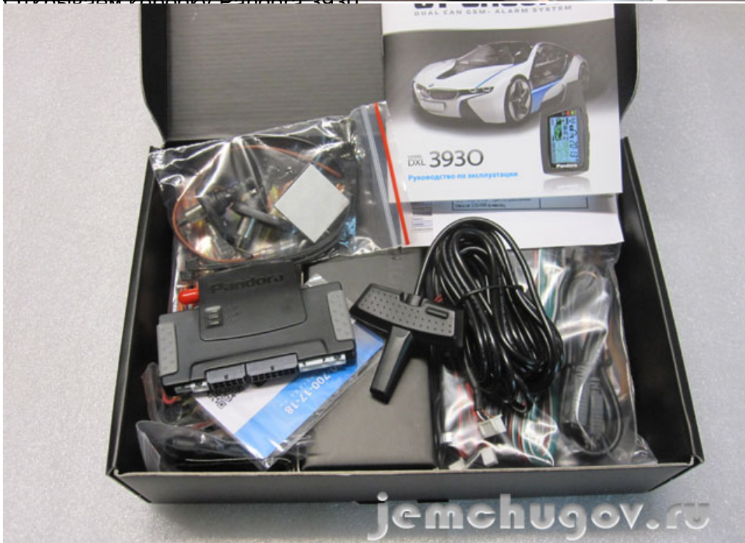
В комплект входят: панель с микрофоном, пульт, реле, две метки, антенна, релейный модуль,