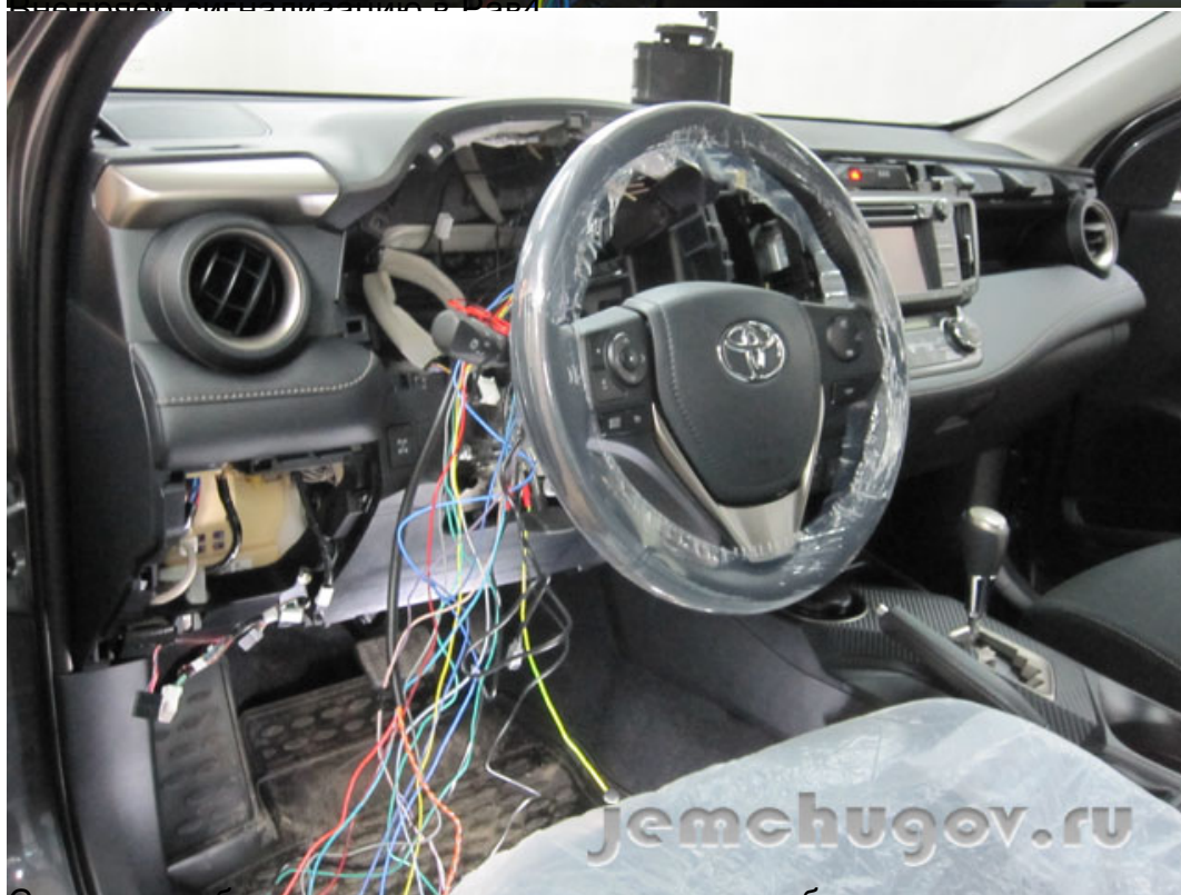
Слегка разобрав торпеду, подключаем все необходимые цепи