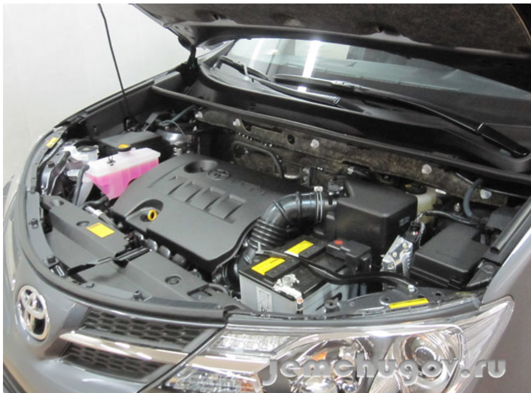
Под капотом Toyota Rav4 устанавливаем сирену и датчик температуры двигателя