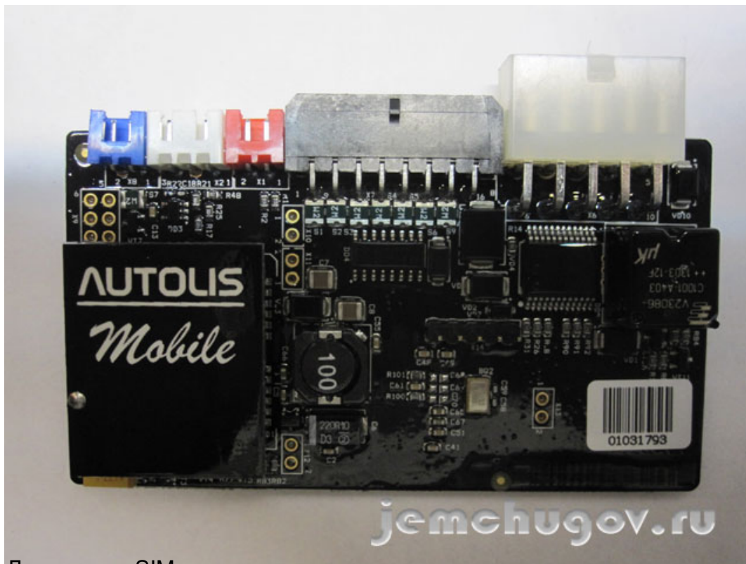
Переходник SIM карты находится на плате