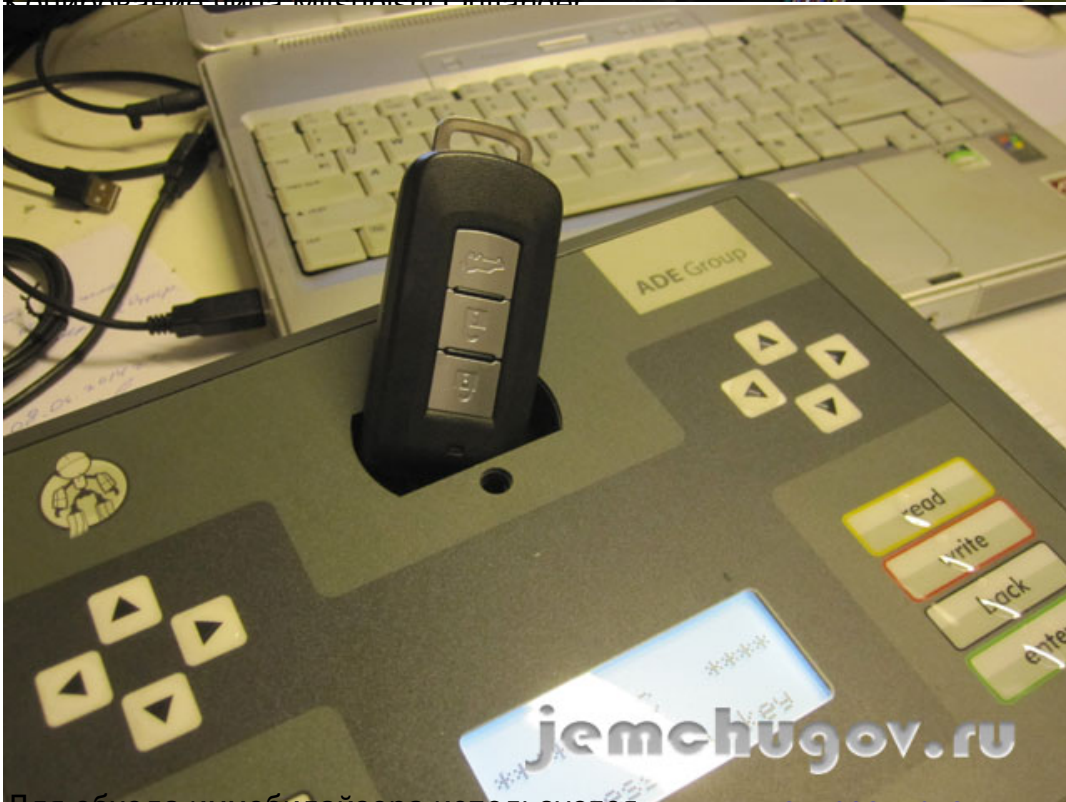
Для обхода иммобилайзера используется чип для автозапуска