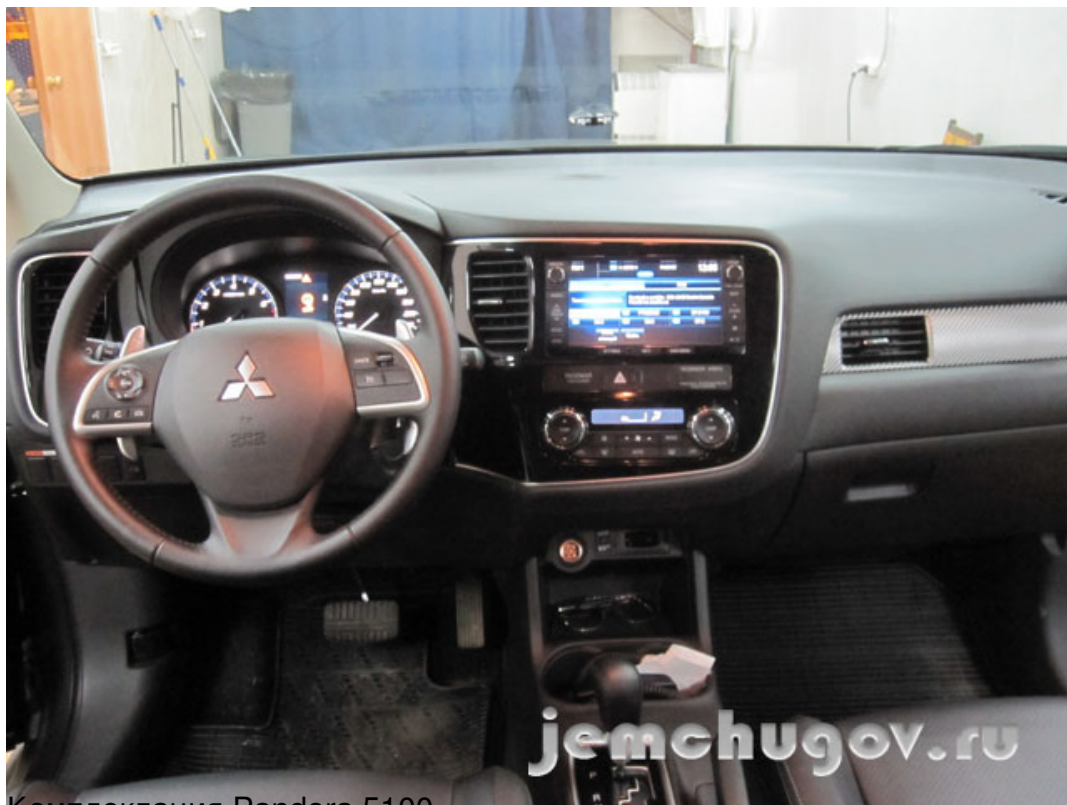
Комплектация Pandora 5100