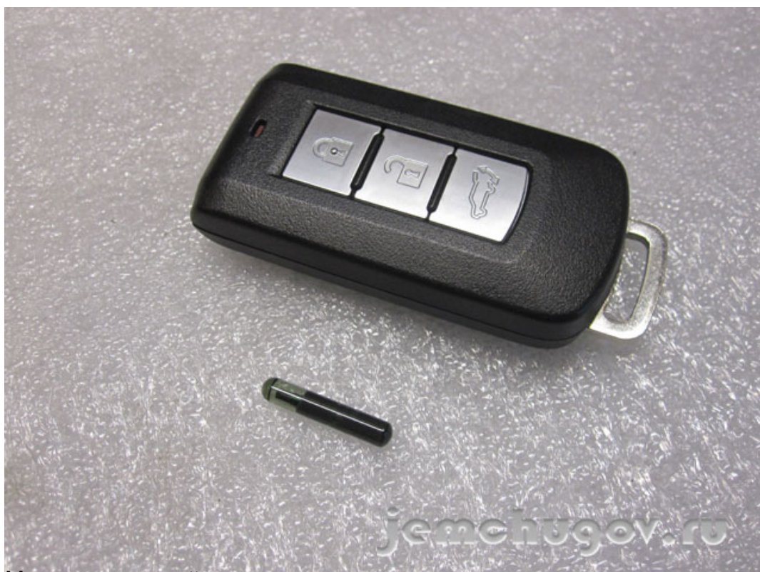
Монтаж охранной системы