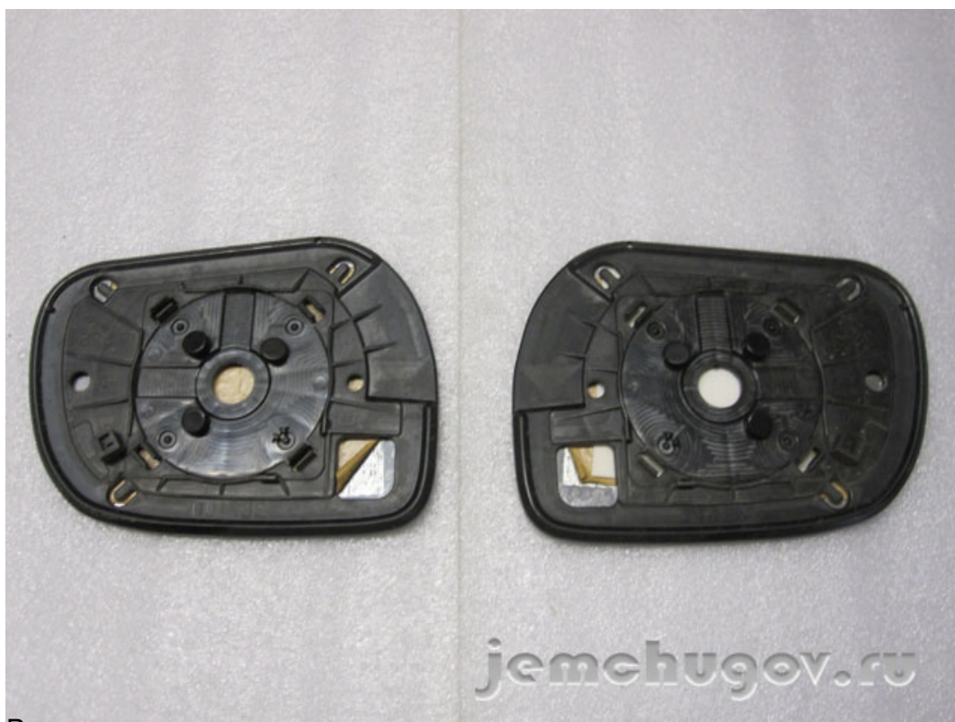
Вынимаем зеркала из обр