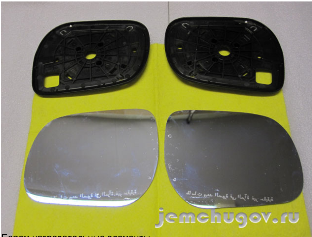
Берем нагревательные элементы