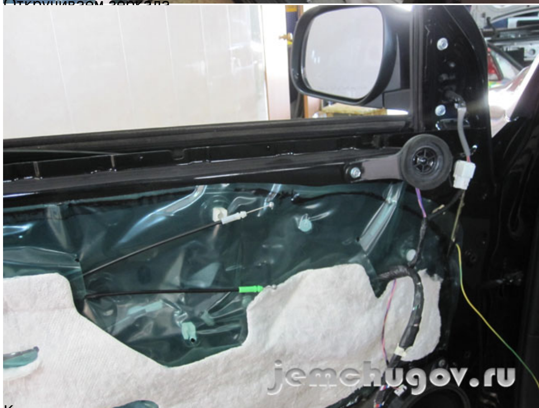
Кладем на стол