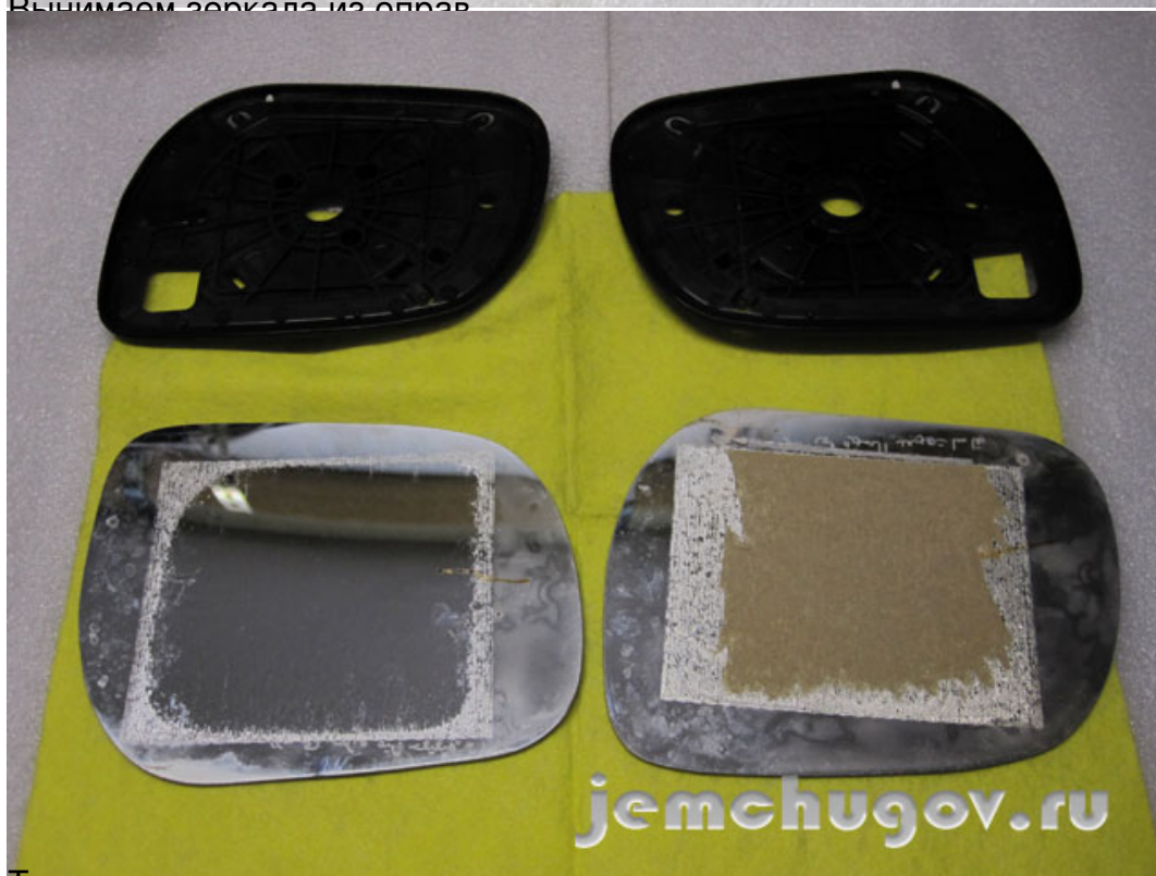
Тщательно очищаем поверхности