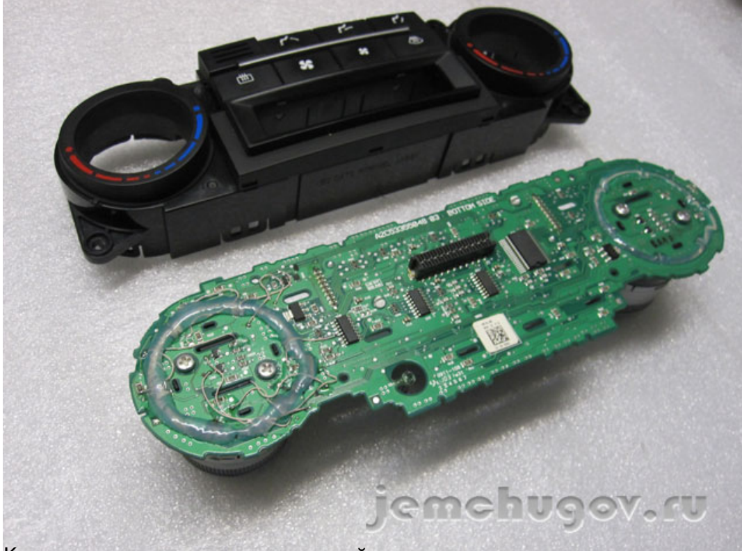
Климат контроль снова, как новый