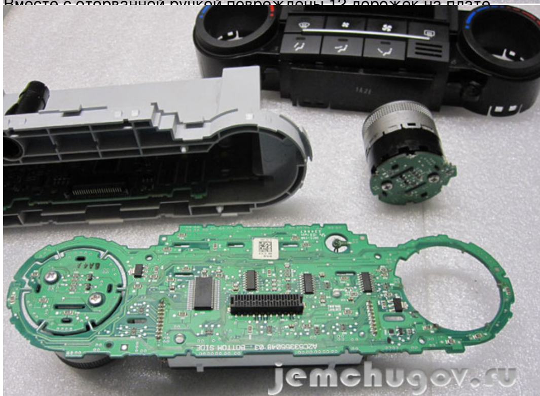
Все порванные дорожки восстанавливаются проволочными перемычками