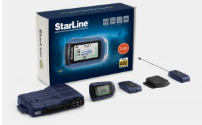
Автосигнализация StarLine с автозапуском, модели A92 Diesel Flex CAN, с функцией CAN